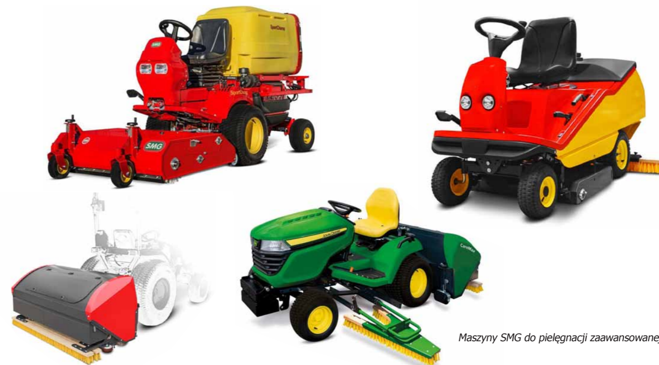
Maszyny SMG do pielęgnacji zaawansowanej

do nawierzchni w równomiernych ilościach, uzupełnianie ubytków materiału wypełnienia, poluzowanie zbitego materiału wypełnienia, prostowanie włókien oraz czyszczenie dogłębne tj. zbieranie pyłów, kurzu i drobin mikroplastiku.