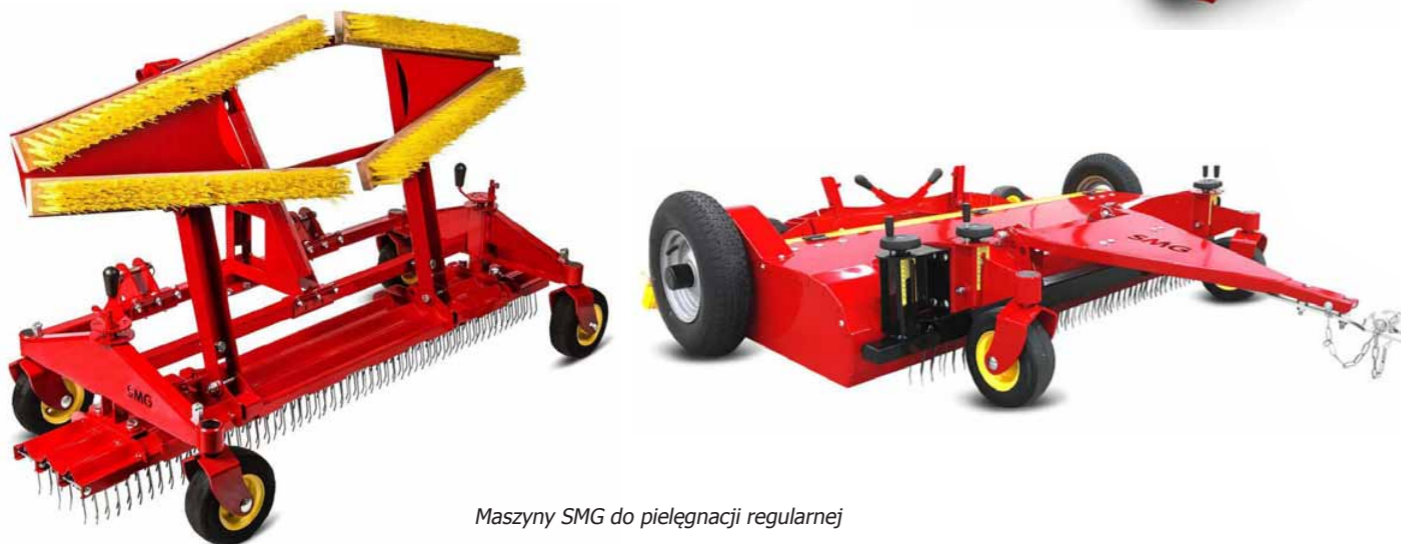
Maszyny SMG do pielęgnacji regularnej

Dodatkowo należy wprowadzić pielęgnację zaawansowaną , która wykonywana jest za pomocą urządzeń profesjonalnych, takich jak szczotki obrotowe z napędem silnikowym, regulowane sita, turbiny ssące czy zgrzebła